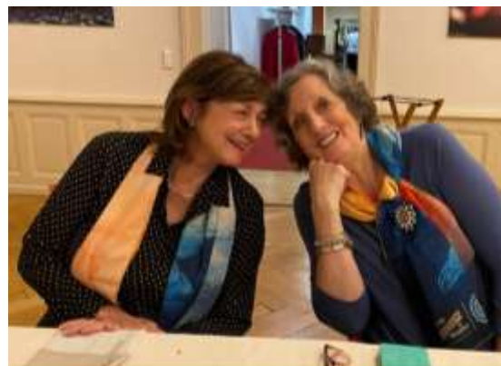
Ein vergnüglicher letzter Abend