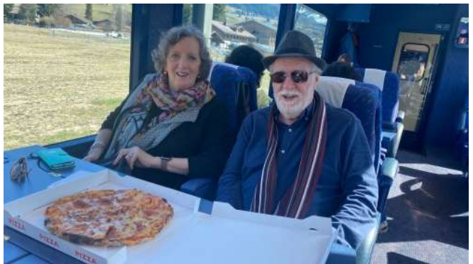
und dann wieder im Zug bis Montreux