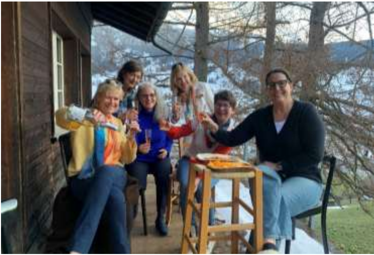
Aperitif auf dem Balkon im Chalet