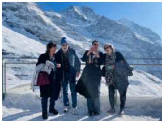
Grossartig, diese Bergkulisse