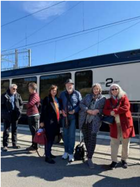
Ungeplanter Zwischenhalt in Zweisimmen