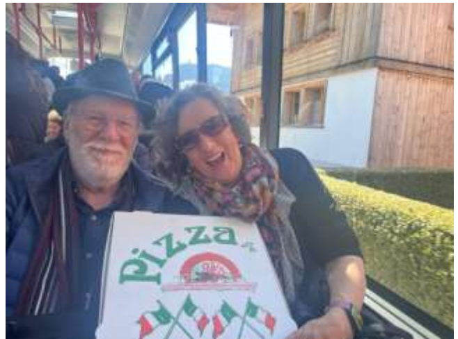
Nach 2 Stunden endlich weiter mit dem Bus nach Gstaad