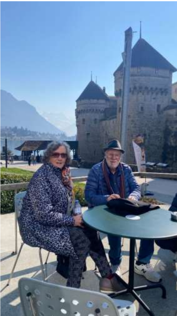
Endlich angekommen beim Château Chillon