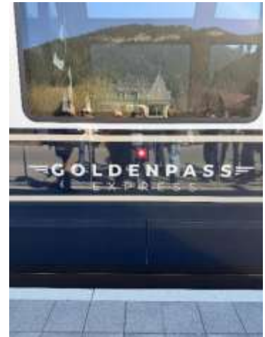
Mit dem Zug von Grindelwald nach Interlaken, dann mit dem GOLDENPASS EXPRESS nach Montreux (was heisst express???...)