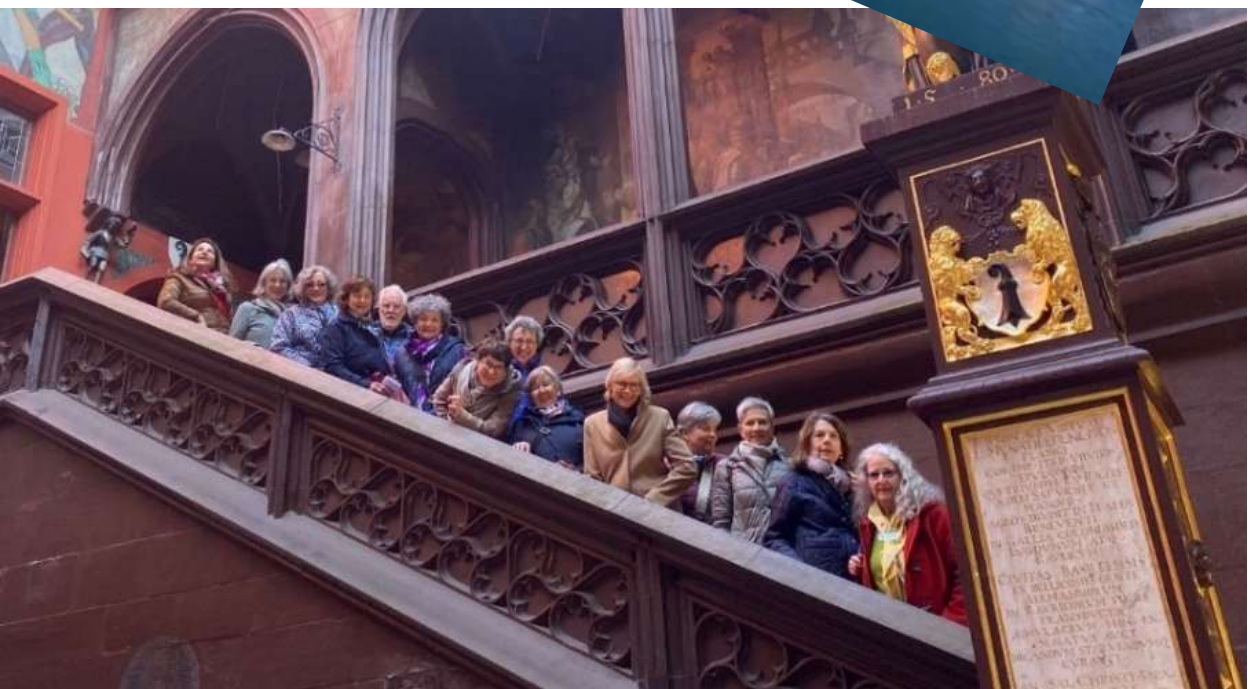
Die gesamte IW-Gruppe auf den Stufen des Basler Rathauses, das zwischen 1504 und 1514 erbaut wurde